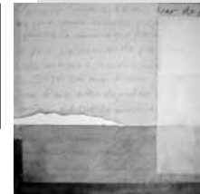
Atelier 61 Nicola Berner