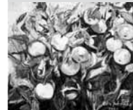
Oda Schielicke „Lebendige Äpfel“